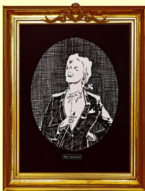
Max Sydendal, tegnet af Asger Larsen, 1986